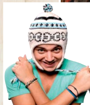
Kev Adams (Humour)