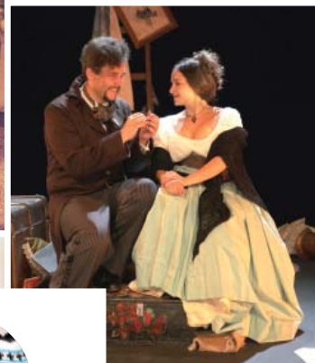
Il faut qu'une porte soit ouverte ou fermée (Théâtre)