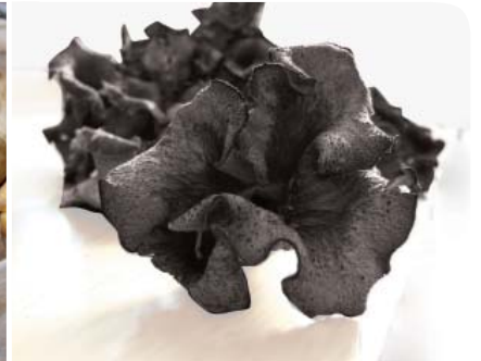
De gauche à droite : bolets, Chanterelles, trompettes de la mort.