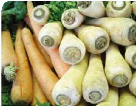
Carottes et panais

À l'heure où les émissions culinaires fleurissent sur nos écrans, où l'on prône le bio et préconise de manger 5 fruits et légumes par jour, les légumes d'autrefois font leur grand retour sur les étals des maraîchers comme dans nos assiettes. Simple phénomène de mode ou nostalgie des temps anciens où les légumes avaient du goût ? Riches en saveurs et en qualités nutritionnelles, ces légumes oubliés et pourtant de saison méritent bien leur place sur nos tables.