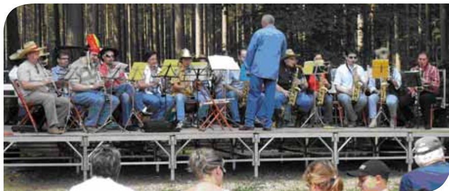
Fête au Poteau, juin 2009, musiques et costumes sur le thème du Western

La Musique Municipale de Pont-Sainte-Maxence célèbre, cette année, les 80 ans du rattachement de la fanfare (fondée en 1865) à la Municipalité. Quatre-vingt années de cérémonies patriotiques, de concerts et d'animations de grandes fêtes populaires (Fête de la Mer, Fête des 100-20, Fêtes de Jumelage, Bicentenaire de la Révolution, Cinquantenaire des 3AP, Comédies Musicales...). La Musique Municipale de Pont-Sainte-Maxence continue par ses prestations à animer la Communauté de communes.