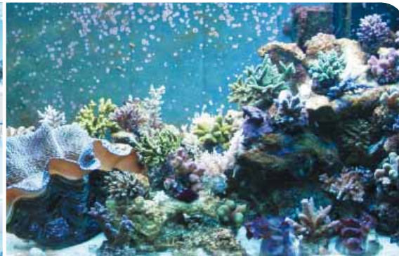
Quelques variétés de corail dur