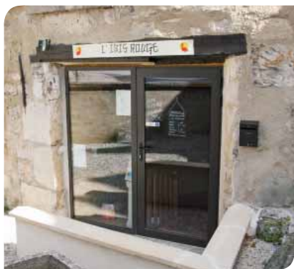
Devanture de l'institut l'Ibis Rouge