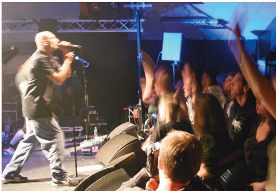
Concert à la Manekine

Notre projet se traduit par une offre culturelle représentant la pluralité du spectacle vivant, de haute facture artistique, tout en restant populaire : théâtre, musique, spectacles pluridisciplinaires mêlant vidéo, arts numériques et musique. Un partenariat renforcé avec des associations culturelles et artistiques de notre territoire nous permet de concrétiser des projets communs. Notre activité se retrouve aussi pleinement dans nos actions en direction des jeunes publics : spectacles pour les différents âges, sensibilisation artistique dans les écoles, ateliers de théâtre et de musique dans les collèges. Nous construisons nos publics de demain et posons notre pierre à l'édifice d'une culture plurielle, critique et citoyenne.