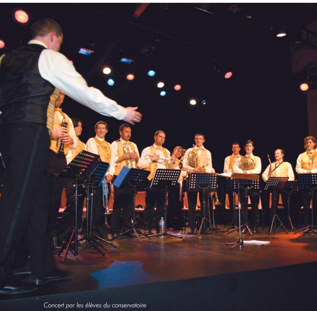
Concert par les élèves du conservatoire

bilisation de tous les publics à la culture notamment par la programmation d'une saison culturelle.