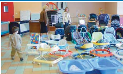
Bourse aux matériels de puériculture

1 re bourse aux matériels de puériculture organisée par le Relais Assistantes Maternelles à Monceaux.