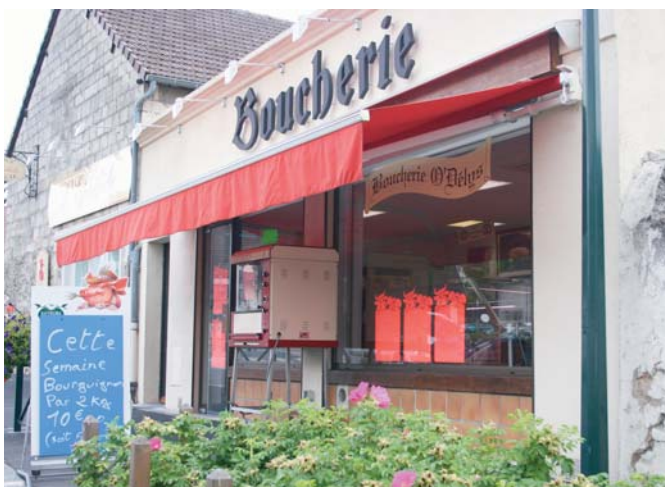
La Boucherie de Rieux

Dans la poursuite de sa mission initiale, le service développement économique continuera à soutenir les artisans et commerçants locaux - comme les commerces de bouche ou services de proximité - assurant ainsi la vie locale dans chacune de vos communes.