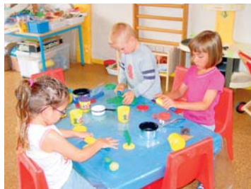
Centre de loisirs

■ Les artisans peuvent se former sur l'outil informatique à Picardie en ligne, en partenariat avec la chambre des métiers de l'Oise.