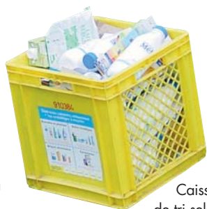
Caissette de tri sélectif

Le SIRTOM a lancé la collecte sélective sur l'ensemble du territoire du syndicat dont dépendait la CCPOH. Les habitants se voient proposer 2 caissettes de tri, bleues et jaunes, devenues familières à bon nombre d'entre-nous.