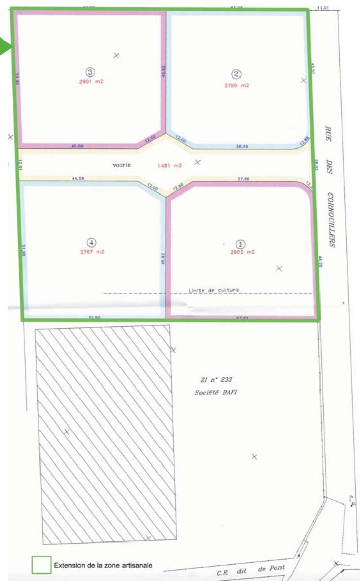
Extension de la zone économique de Sacy-le-Grand

La création d'une nouvelle zone d'activités sur le secteur de Bazicourt, Saint-Martin-Longueau et Sacy-le-Petit est en discussion. Elle permettra à terme d'accueillir des entreprises et de créer des emplois sur notre territoire.