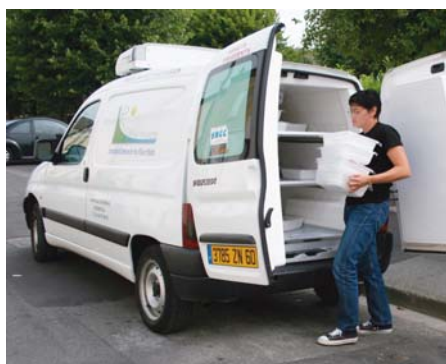
Portage de repas

Mise en place du service de portage repas à domicile pour les personnes âgées.