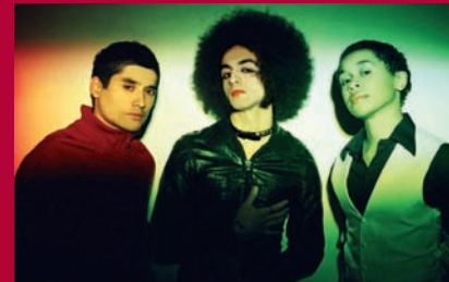
Fancy : le glam rock fait son retour le 19 octobre à la Manekine.

Des critiques élogieuses de Télérama, Rock and Folk, le Parisien confortent Fancy dans sa position de groupe novateur et déjanté. A découvrir absolument.