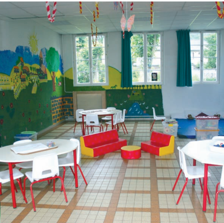
Accueil périscolaire Max Drain

Dès septembre, le service jeunesse va organiser des animations sportives régulières dans les gymnases, salles de sports et espaces sportifs de plein air.