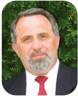
Antoine AUBREE Président de la Communauté de Communes des Pays d'Oise et d'Halatte