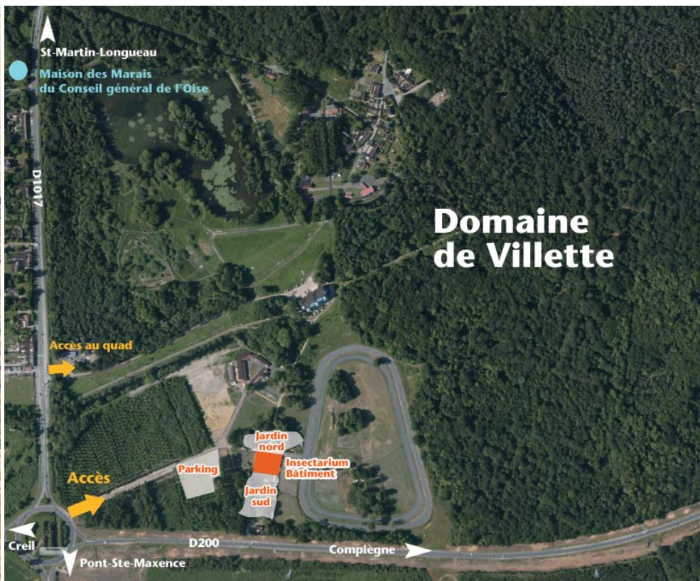
De gauche à droite : Croquis de l'aménagement intérieur de l'Insectarium proposé par Kanopée / Vue aérienne de l'implantation de l'Insectarium.