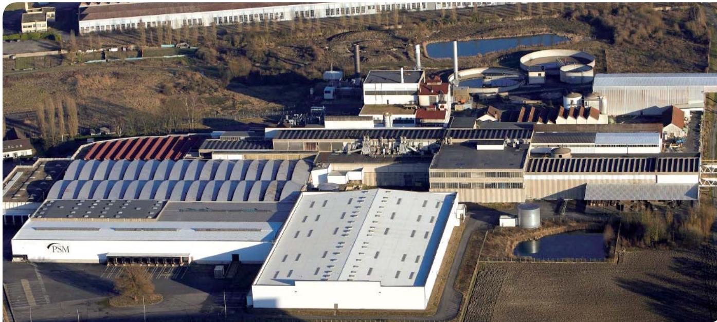
Vue aérienne du site Paprec à Pont-Sainte-Maxence.

Le groupe Paprec a été désigné par le Tribunal de Commerce le 23 juin 2010 comme repreneur du site de l'ancienne papeterie. Depuis cette date, la société s'est heurtée à un problème de taille qui a compliqué son arrivée.