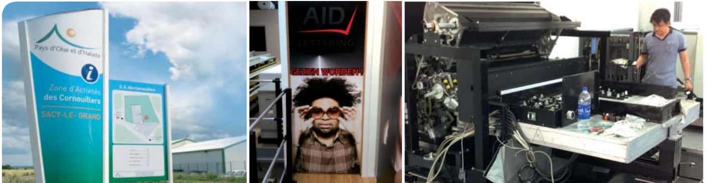
De gauche à droite : Zone Artisanale Les Cornouillers/ Impression réalisée avec une imprimante numérique pour une utilisation industrielle / Montage d'une imprimante numérique par l'entreprise Digilarger.

Nous vous proposons de découvrir les deux nouvelles sociétés qui s'implanteront prochainement sur le site.