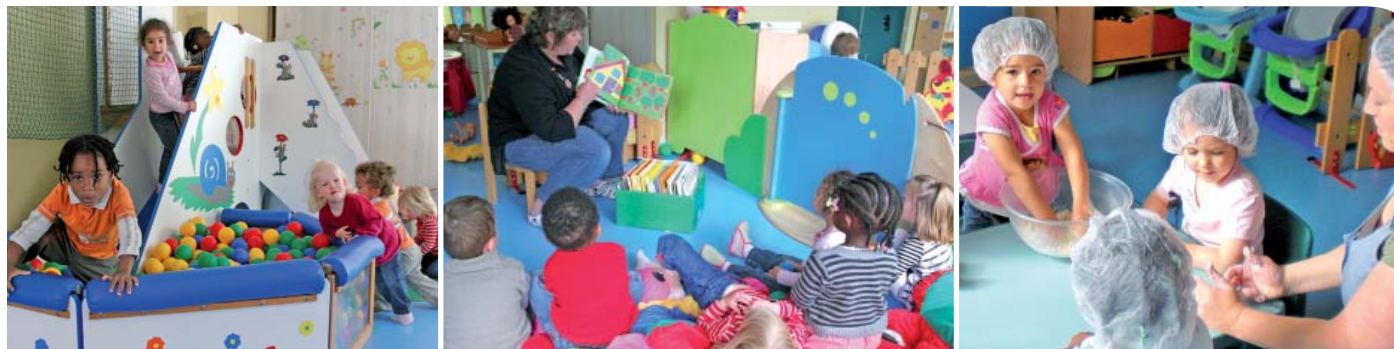
De gauche à droite : atelier de psychomotricité / Atelier lecture / Atelier cuisine.