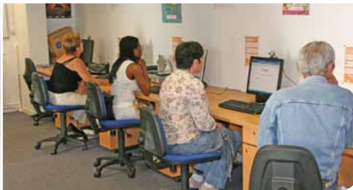
Salle Picardie en ligne, La Manekine à Pont-Sainte-Maxence