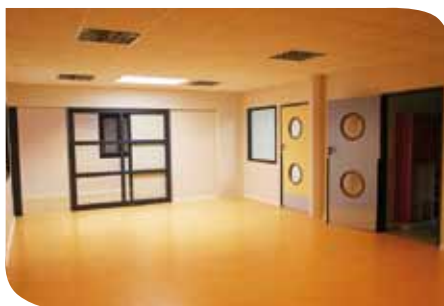
Salle de psychomotricité

Ces aménagements vont permettre d'axer le projet éducatif sur l'autonomie de l'enfant, par le biais d'activités proposées et de jeux libres.