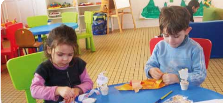
Un des ateliers du service enfance-jeunesse