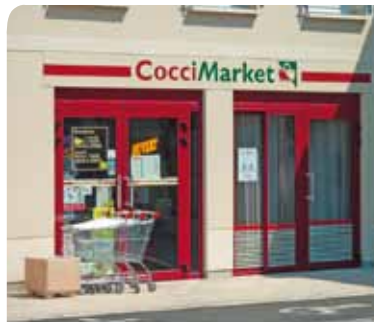
La nouvelle enseigne Cocci Market

Aux jardins de Sacy - 85 route de Cinqueux - 60700 Sacy-le-Grand Tél. : 03 44 29 94 62 Email : auxjardinsdesacy@hotmail.fr