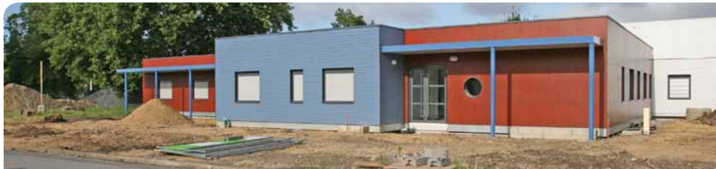
La nouvelle crèche intercommunale Ribambelle en juillet, pendant les travaux

Devenue inadaptée et sous dimensionnée, la crèche multi-accueil Ribambelle fait peau neuve et s'installe au 50 rue Ampère à Pont-Sainte-Maxence. Dotée d'une capacité de 39 places, elle accueille vos enfants depuis le 30 août.