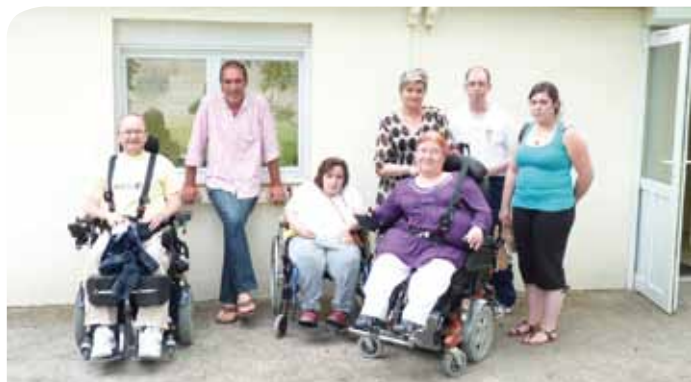
Groupe des personnes à mobilité réduite à Verneuil-en-Halatte

Dix ans déjà que ce service, créé en novembre 2000 à l'initiative de la Région Picardie et en partenariat avec la CCPOH, propose au grand public des formations gratuites à l'usage d'Internet, de l'informatique et des multimédia. Pour la rentrée, Picardie en ligne étend sa gamme de formations et vous propose de nouveaux ateliers.