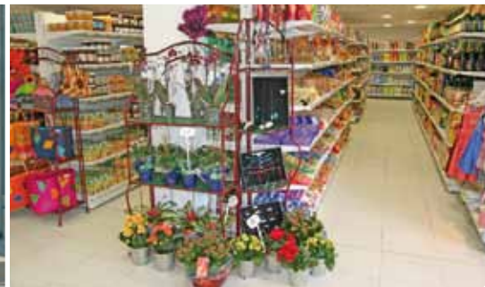
L'artisanat local côtoie les produits d'épicerie classique