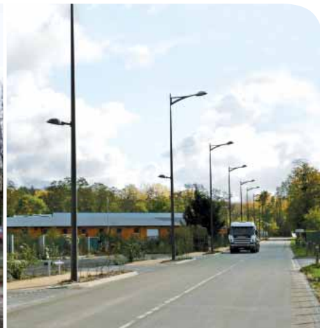
Premiers coups de pioche pour la construction de la nouvelle crèche / 1 re phase des travaux de la zone Moru/Pontpoint.