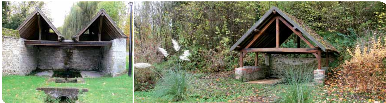
Lavoir de la Fontaine Sainte-Barbe, rue de la Forcherie à Pontpoint / Lavoir de Fosse au chemin du Marais à Roberval.

Les lavoirs font très souvent partie du paysage rural. Restaurés ou abandonnés, ces monuments étaient un lieu de rendez-vous et de vie important à l'époque où la machine à laver n'existait pas.