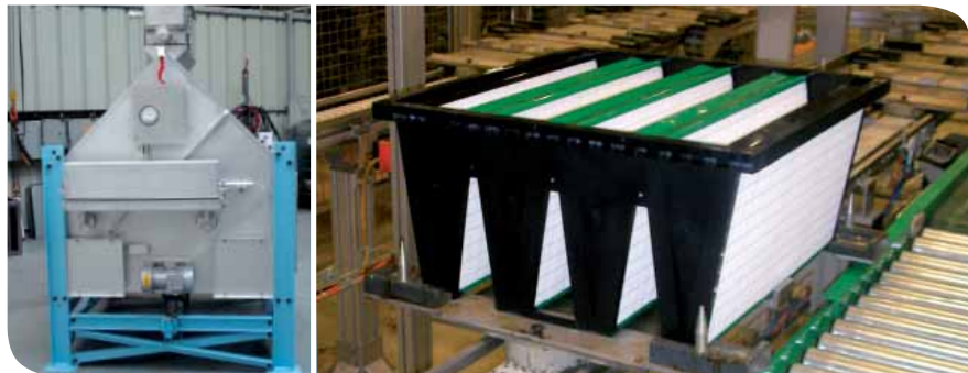
Piège à iode radioactif / Opakfil, filtre phare de l'entreprise.

Camfil Farr, usine implantée depuis 1978, à Saint-Martin-Longueau, produit chaque jour des filtres pour obtenir un air irréprochable. Consciente que la filtration d'air rime avec sécurité et santé, l'entreprise s'engage de plus en plus pour une réduction de son impact environnemental.