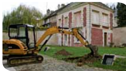
Parc du conservatoire avant les travaux.

En décembre 2009, les travaux d'aménagement du parc du conservatoire Adam de la Halle ont été entrepris afin d'en faciliter l'accès et de mettre en valeur l'édifice. Ces travaux concernent : • La création de voirie piétonne adaptée aux personnes à mobilité réduite. • La rénovation du parvis pavé. • La plantation d'arbres et d'arbustes. • La création d'un amphithéâtre végétalisé pour des représentations extérieures.