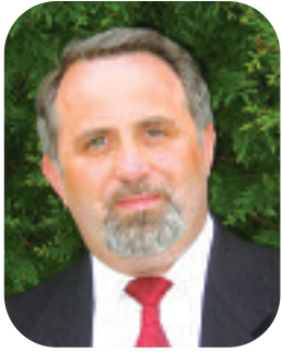
Antoine AUBREE Président de la Communauté de Communes des Pays d'Oise et d'Halatte