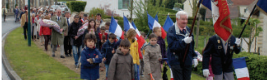
Défilé à Pontpoint

Cérémonie de l'Armistice Rens Mairie : 03 44 72 24 61